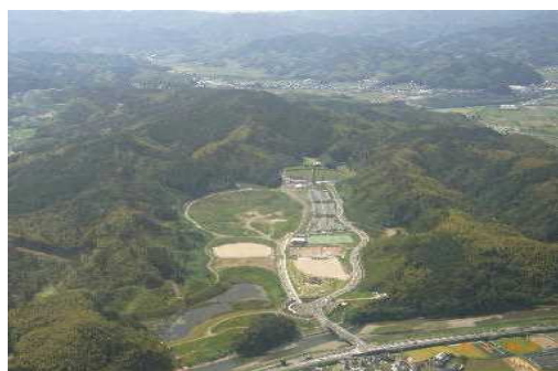
南部健康運動公園

また、都市緑化に対する意識の向上を図るため、官民協働により花壇づくりを進める「みどりのキャンパスプロジェクト事業」や「暮らしの緑化推進絵画コンクール」の開催により普及啓発を進めています。