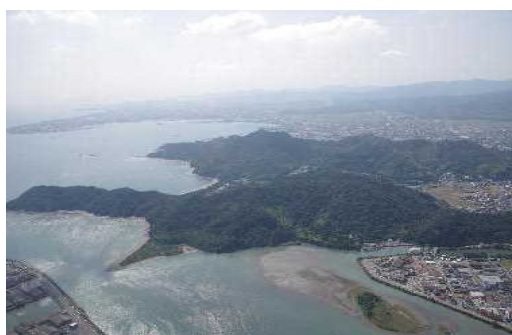
日の峰大神子風致地区

平成29年度末における県下の風致地区の指定状況及び平成29年度中の風致地区内における許可等の件数は表4-2-3のとおりとなっています。