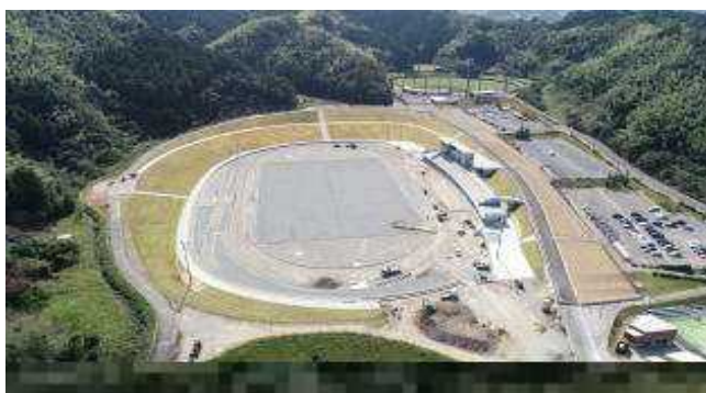
南部健康運動公園

風致の適切な維持に努め、都市の自然と美しい景観を守り、調和のとれた住みよいまちづくりを図ります。