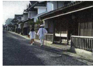
歴史的文化的街並み

貴重な動植物や地質鉱物の保護・管理のために、国や県、市町村では文化財保護法や文化財の保護に関する条例等に基づき、文化財の指定を行っています。本県では、動物13件（うち国指定10件）、植物62件（同11件）、地質・鉱物11件（同4件）の指定が行われているほか、市町村指定の天然記念物は、140件を超えています。また、県では、16名の文化財巡視員を配置し、その管理を図っています。