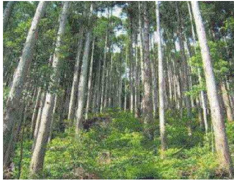
多様な機能を有する森林

今後も、間伐等による健全な森林整備や保安林の指定などにより森林の適切な保全・管理を図るとともに、県民が森と親しめる機会を拡充していきます。