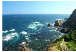
室戸阿南海岸国定公園

本県は、森林が県土の4分の3にあたる314,882haを占める森林県であり、木材生産はもとより、県土の保全、水資源のかん養、野生生物の息や県民の保健・休息の場、そして二酸化炭素を吸収・固定し地球温暖化を抑制するなど、様々な恵みをもたらしています。このため、森林の保全にあたり地域森林計画を策定し適切な管理と森林整備を進めているほか、森林の有する公益的機能の保全のために保安林の指定を行っており、令和元年度末現在、116,628haの保安林を指定しています。