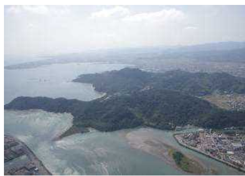
日の峰大神子風致地区